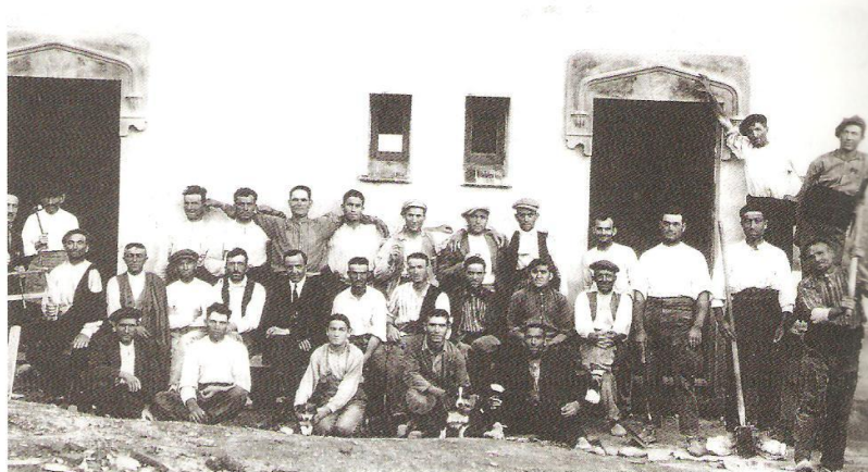
Un grup de treballadors en finalitzar una jornada de treball.

Després de nombroses gestions, l'any 1945 foren escripturades per l'Instituto Nacional de la Vivienda i a favor dels socis de la Cooperativa, les finques que ja ocupaven abans de la