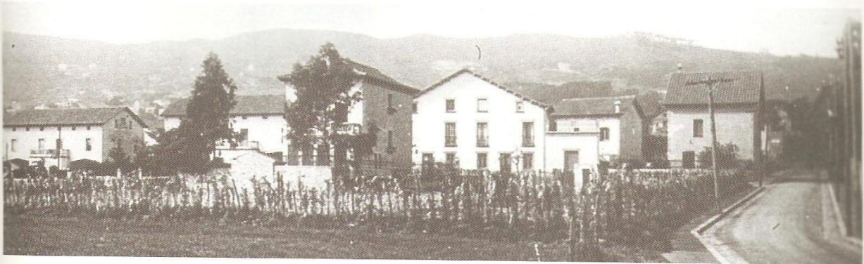
Grup de cases a tocar del carrer Eduardo Conde (Fotografia anys 20: Col·lecció Narcís Rucabado)

Les cases barates es troben a la part sud de Sarrià, a tocar de Les Corts, entre el Convent dels Caputxins i el carrer Manuel Girona. Actualment encara és un conjunt arquitectònic que tot i la seva modèstia fa goig de veure'l. Les casetes que encara resten en peu molt aviat compliran un segle de vida.