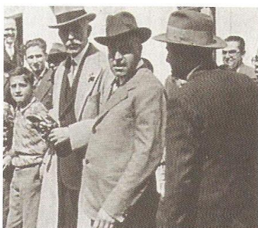
Visita del President Macià amb motiu de la inauguració del complexa d'habitatges

de Senillosa (avui Capità Arenas), finques de les famílies Güell, Folch, Girona i Vila Elena, tocant al que és avui Parc Vil·la Amèlia.